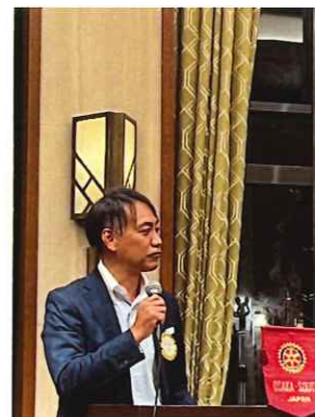
Gテーブル：柚例会運営委員長