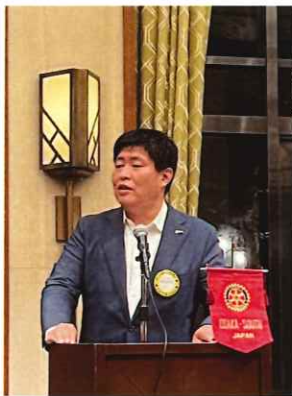
Fテーブル：橋本会員友好委員