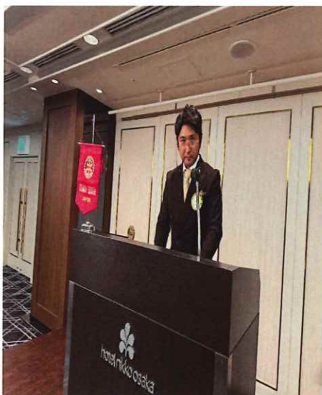
Gテーブル：下井国内社会奉仕委員長

「職場見学会」に関しては、社会見学の場所として青山会員より竹中大工道具館を推薦する意見がありました。