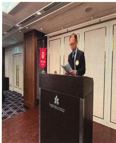
Fテーブル：島本国内社会奉仕委員