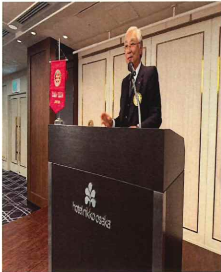
Eテーブル：米倉職業奉仕委員