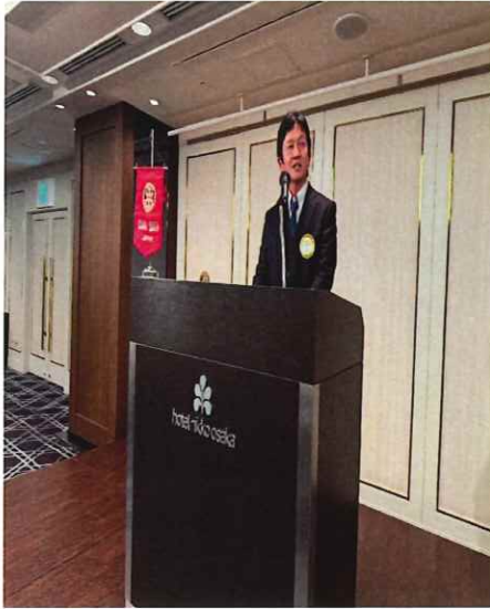
Cテーブル：大桑職業奉仕副委員長